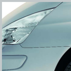
Бежевый «Ангора» А19(TE)