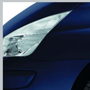
Синий «Сумеречный» 472 (NV)