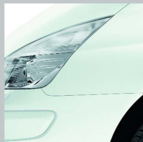
Белый Лед 369 (OV)