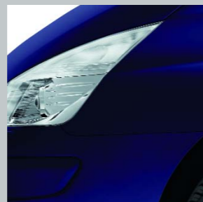
Темно-синий D42 (OV)