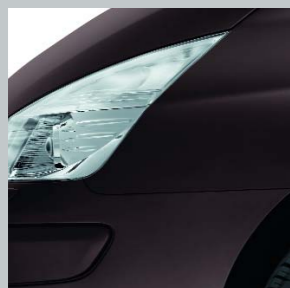
Засахаренный каштан D17 (TE)