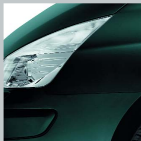
Зеленый «Бездна» 903 (OV)