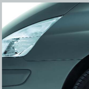
Серый «Затмение» В66 (TE)