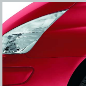
Огненно-красный В76 (TE)