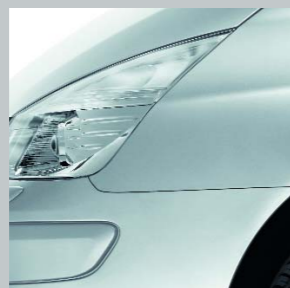
Серый платиновый D69 (TE)