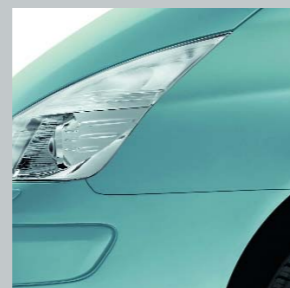
Голубой «Гроза» D47 (TE)